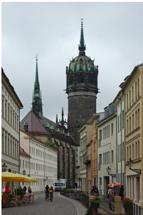
Замковая церковь в Виттенберге.

Тот факт, что первичный документ Реформации найден накануне ее пятисотлетия, столь же символичен, сколь и случаен. Если бы не подготовка к юбилейной выставке в другой библиотеке, в Грайфсвальде, находки не было бы. Организаторы выставки искали сведения о хранении прижизненных изданий Лютера и оригинальных текстов, вышедших из-под его пера. По некоторым косвенным указаниям в межбиблиотечных источниках они вышли на университет Килья, где, возможно, сохранились старинные раритеты. И здесь совместный поиск с местными сотрудниками увенчался успехом.