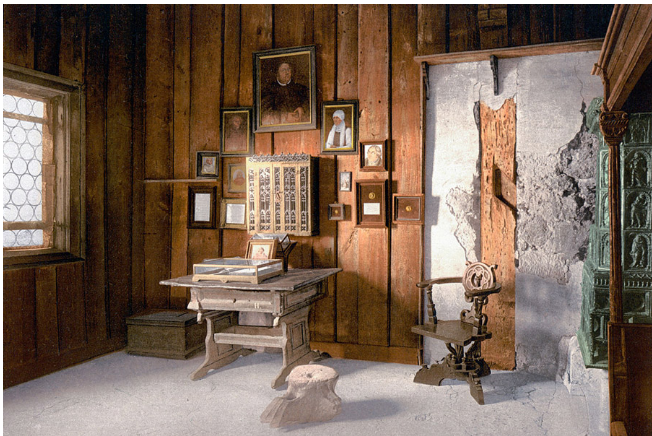
Комната Мартина Лютера в замке Вартбург.