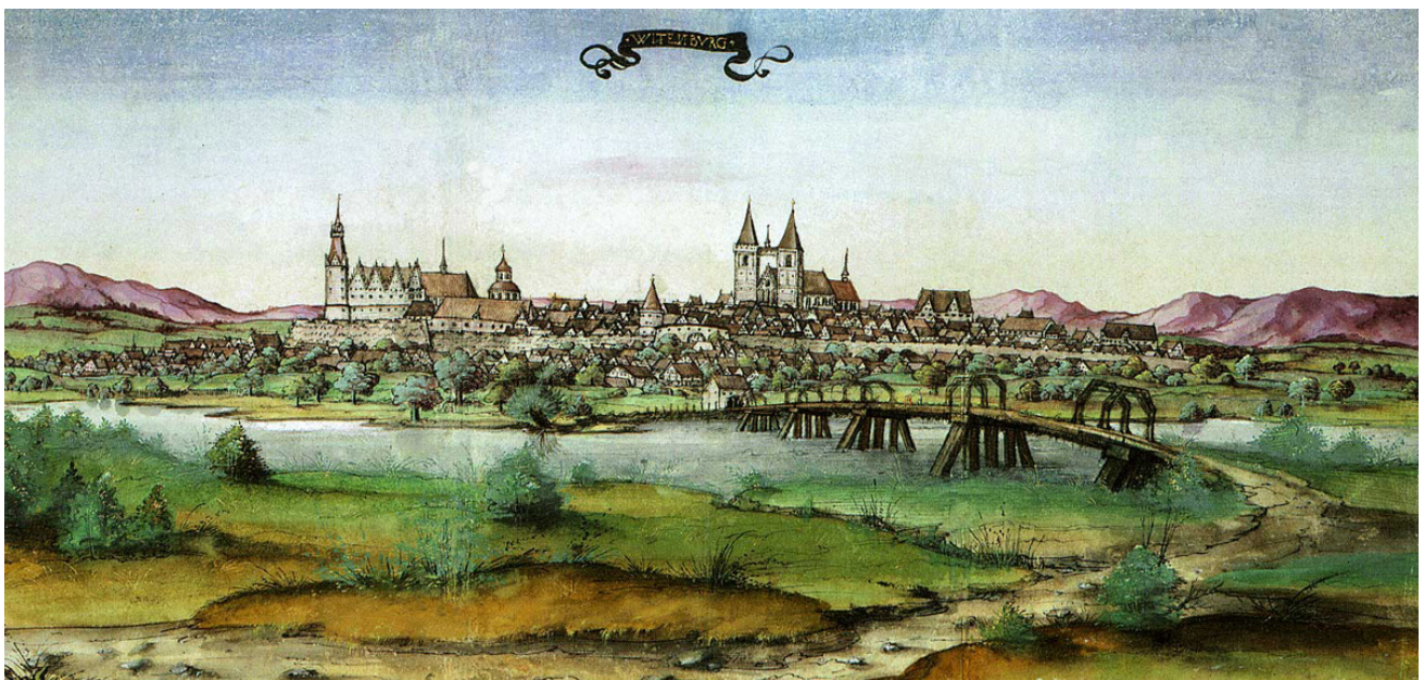
Лютерштадт Виттенберг. 1536/37 год.

Обнаружено там и первое издание Нового Завета на нижненемецком языке, на котором говорят в северных и северо-западных районах Германии. Эта книга 1525 года сохранила оригинальный переплет, тогда как более ранние издания были одеты, наоборот, в более поздние, стандартные переплеты, из-за чего и «растворились» на полках книгохранилищ.