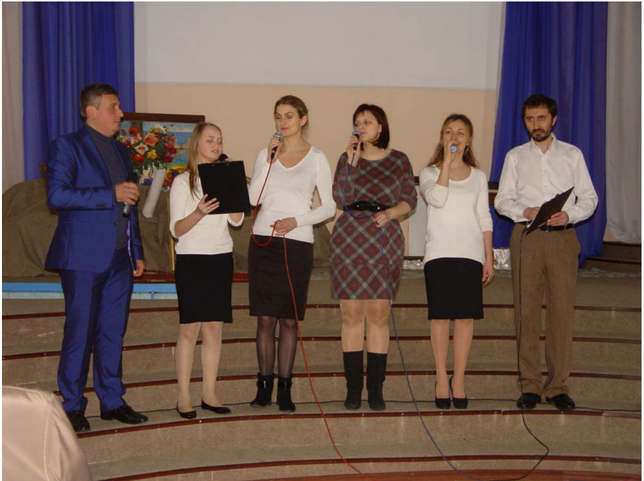
Ирина Воронцовская